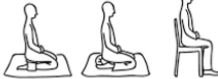
Auf einem Kissenchen