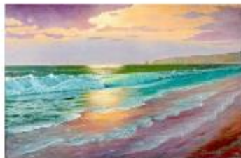
Membaca Alam : I'QRA Oil Painting by Daced Joesoef